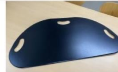
スライディングシート/グローブ