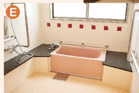
〈E: 浴室〉 ご自宅の浴室に近い環境で入浴していただけます。 〈F: 特殊浴室〉 介助が必要な方には特殊浴槽を設けております。