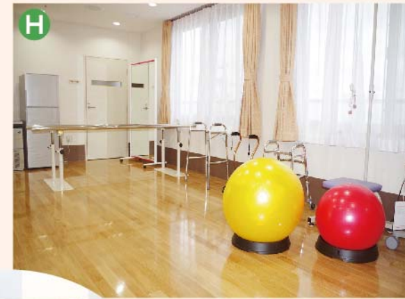
〈H: 通所リハビリテーション室〉 リハビリ・介護スタッフが利用者の生活機能回復のお手伝いをさせていただきます。