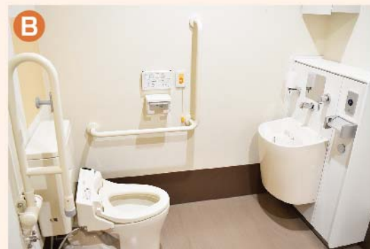
〈B: トイレ〉 車椅子・ストーマを使用している方でも安心して利用いただけるシャワートイレも設置しています。