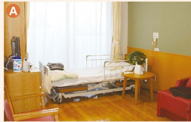
〈A: 療養室〉 お部屋は全個室で、ベッド以外にロッカー・チェスト・ソファ・テーブルが備え付けてあります。自宅で使われていた物や愛着のある物を持ち込んでいただくことは可能です。ご相談下さい。