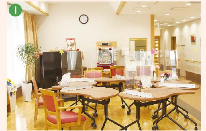
〈I: レクリエーションルーム〉 通所リハビリテーションのご利用者様の喫茶スペース。また季節のイベントを行う空間としてピアノやカラオケの設備があります。パチンコも楽しむことができます。