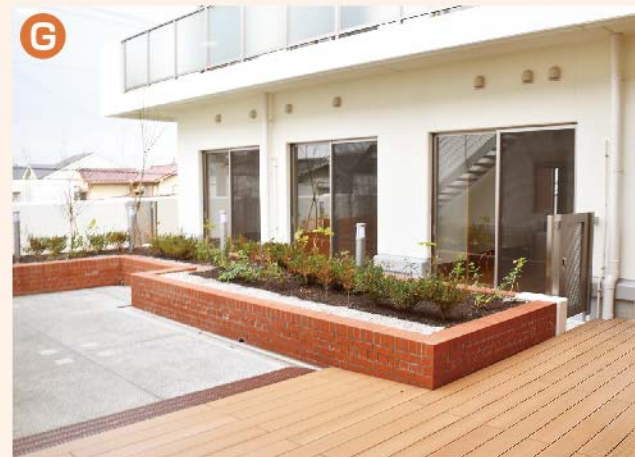
〈G: 庭園〉 庭園は広い空間を設けています。夏祭り等のイベントスペースとして活用し、利用者やご家族に外の空気を感じてもらうことができます。