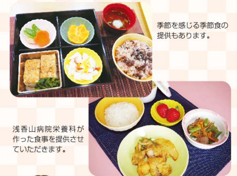
季節を感じる季節食の提供もあります。