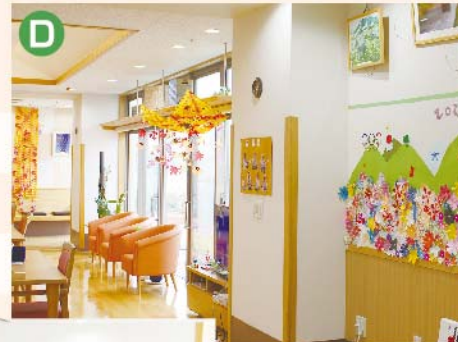
〈C,D: 共同生活室〉 感染予防対策を行い、ユニットのご利用者様で食事・おやつ・レクリエーションを楽しむ空間です。季節ごとの飾り付けをして四季を感じる工夫をしています。